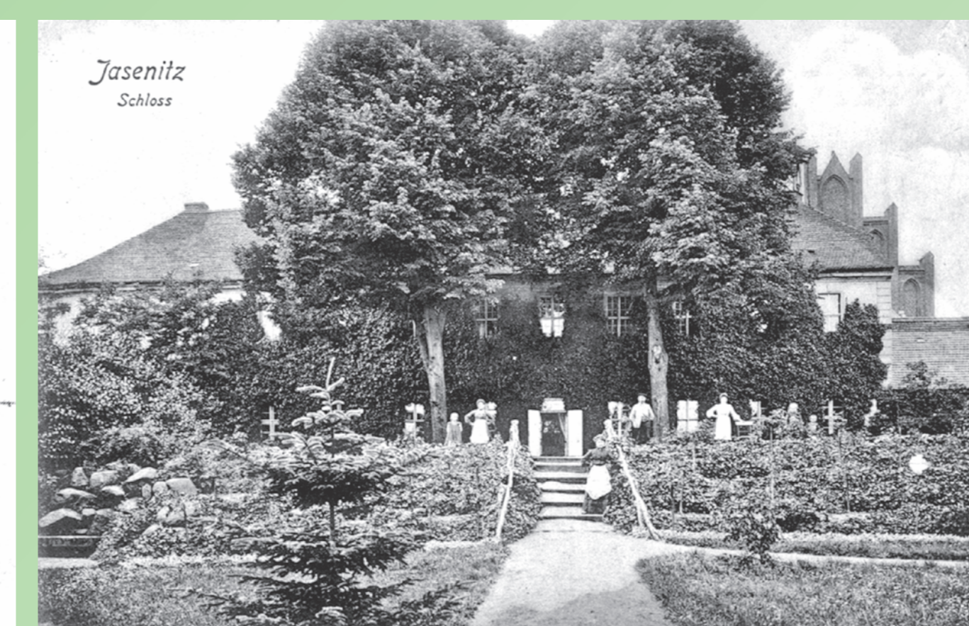
Z lewej - zarys pierwotnego kościoła z zaznaczeniem cmentarza. Wyżej - pałacowy ogród, zdjęcie z początku XX wieku. Links - Umriß der ursprünglichen Kirche mit Kennzeichnung des Friedhofes. Oben - Schlossgarten, Aufnahme Anfang des 20. Jh.