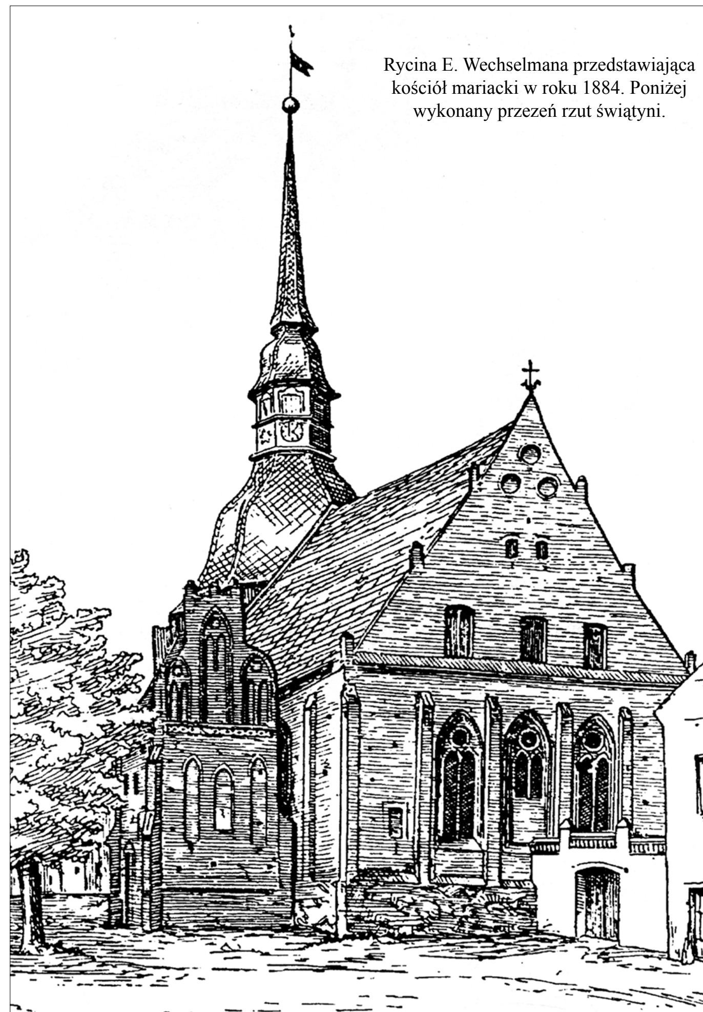
Rycina E. Wechselmana przedstawiająca kościół mariacki w roku 1884. Poniżej wykonany przezeń rzut świątyni.

Informacje o wyposażeniu świątyni pochodzą z okresu po roku 1735 (data wielkiego pożaru) i wskazują na barokowy rodowód wnętrza. Wcześniej udokumentowane są zasoby kościoła (parafii), wiadomo np. o srebrze sprzedawanym w roku 1570, najprawdopodobniej na potrzeby remontowe. Wiemy o istnieniu barokowej ambony, obrazów olejnych (ok. r. 1700) dobrej szko-